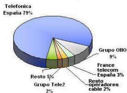
Cuotas de mercado por ingresos totales del servicio telefónico básico fijo