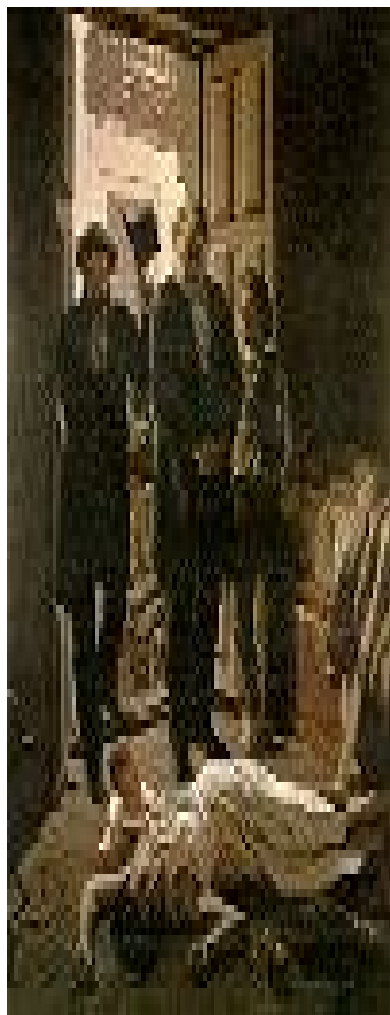
“La fiebre amarilla” Blanes (1871)

“El paciente tiene derecho a revisar su historia clínica y a obtener una copia de la misma, a sus expensas. Igual derecho tienen el o los médicos tratantes, cuando lo soliciten por escrito fundado directamente o mediante representante legal debidamente acreditado ante la Dirección Técnica del establecimiento público o privado de que se tratare, a cuya solicitud y autorización deberán darse curso de inmediato, en las mismas condiciones, también a sus expensas, haciendo constar tal circunstancia mediante indicación de la fecha en que dicha historia clínica fue entregada, en el cuerpo cronológico de dicho documento clínico”