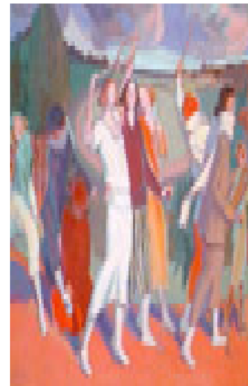
”Deporte” Laborde (1935)