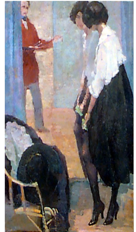
“En el taller” Laborde (1916)

“Los preceptos de la presente Constitución que reconocen derechos a los individuos, así como los que atribuyen facultades e imponen deberes a las autoridades públicas, no dejarán de aplicarse por falta de la reglamentación respectiva, sino que esta será suplida recurriendo a los fundamentos de leyes análogas, a los principios generales del derecho y a las doctrinas generalmente admitidas”