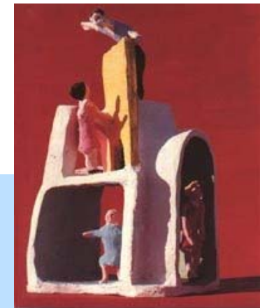
"Entre vecinos" Cabrera (1969)