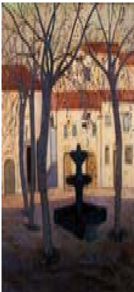
“Plaza de Pollensa” Causa (1915)