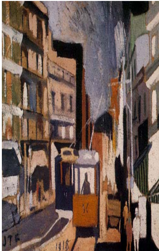
"Paisaje de ciudad" Torres (1928)