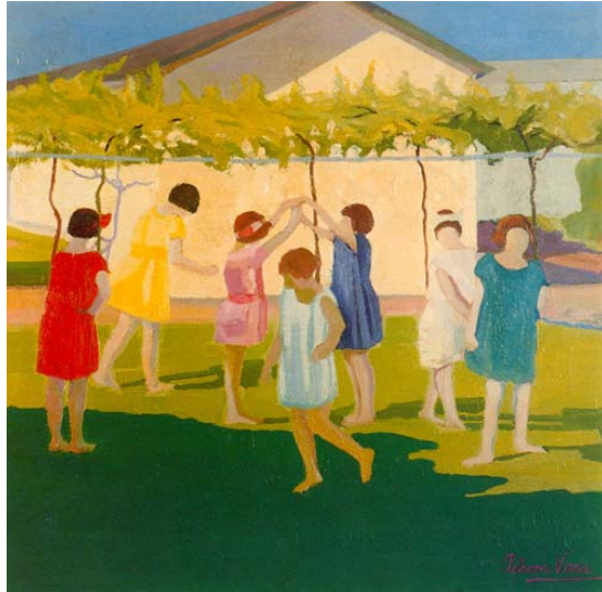
"Recreo" Petrona Viera (1924)

Objetivo: LA MEJORA DE LOS SERVICIOS DEL CIUDADANO, UTILIZANDO LAS TICs.