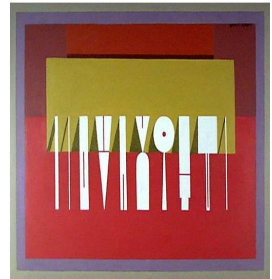
“Naturaleza muerta mental” Nieto (1989)

Si en un plazo de cuarenta y cinco días no hubiera expresión contraria a la propuesta del Poder Ejecutivo, este procederá a su aprobación por decreto...”