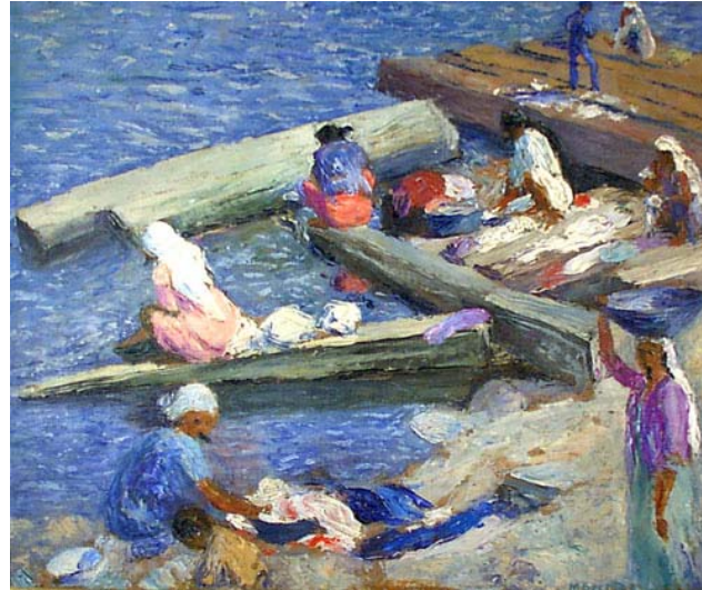
"Lavanderas del Paragua" Berreta (1935)